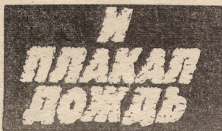
Рис. А. ЛЕБЕДЕВА.